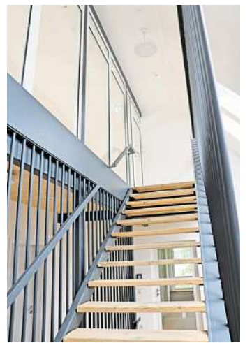
Der Verwaltungstrakt offenbart eine Vielzahl lichtdurchfluteter Büros und Besprechungsräume.