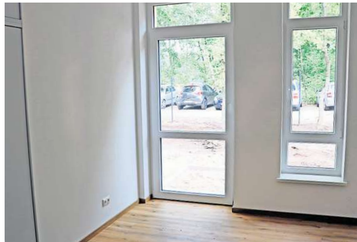
Die Wohnräume im geschützten Bereich sind großzügig, schlicht, reizarm, ruhig und sicher gehalten.

nahme mit einem Investitionsvolumen von vier Millionen Euro im Januar 2023 und endete trotz einiger Widrigkeiten nach 21 Mona-